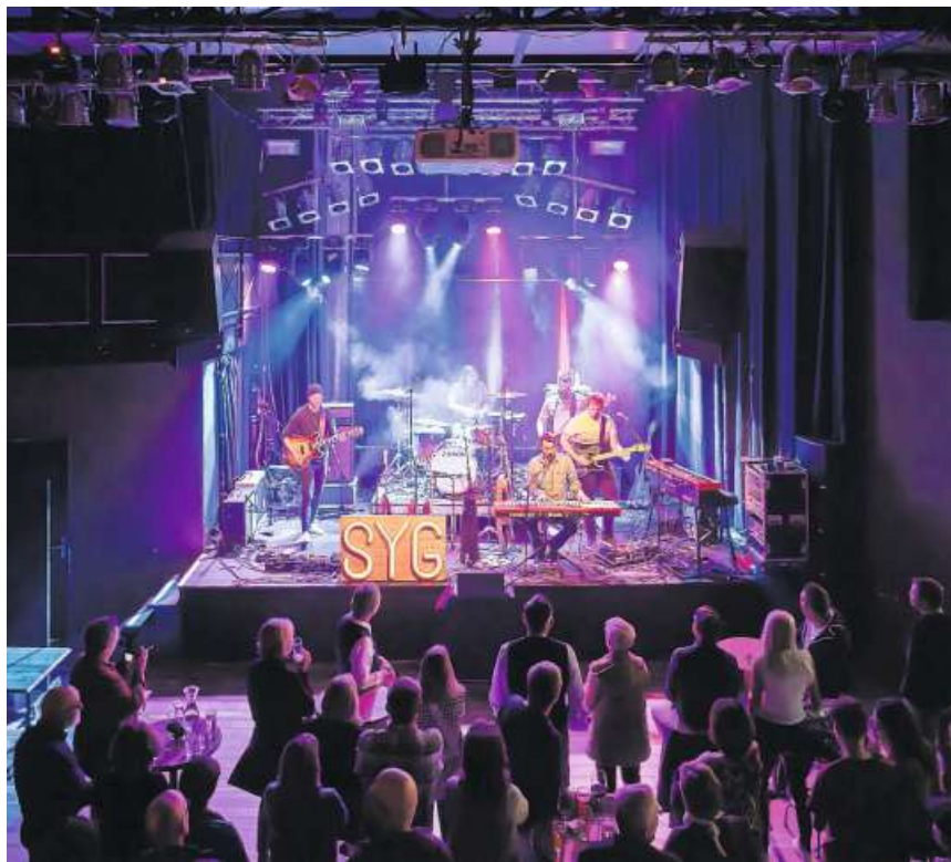
Seven Years Gone bot Rockmusik ohne Schnickschnack.